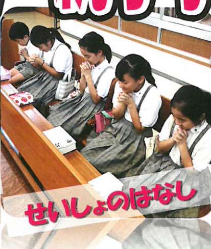
せいしょのはなし