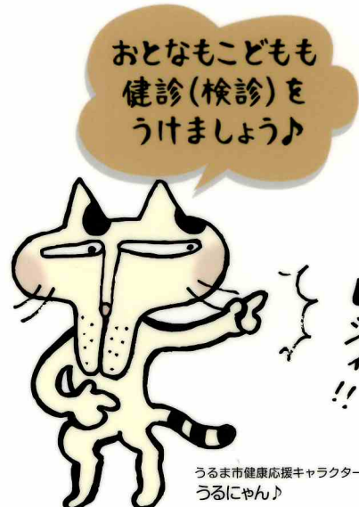
うるま市健康応援キャラクター うるにゃん♪