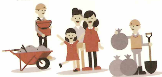
災害ボランティア支援